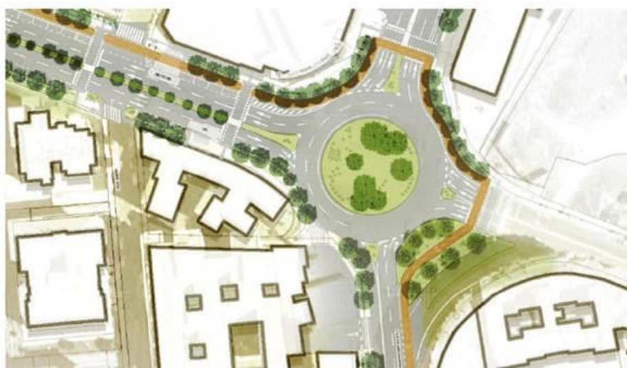
Nueva glorieta en la intersección entre la avenida Eduardo Saavedra (actual N-111, travesía sur) y la avenida de Valladolid.