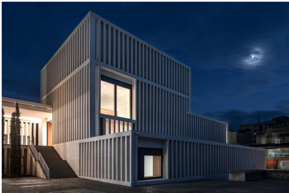
Museo Helga de Alvear, Cáceres. Emilio Tuñón, 2020.