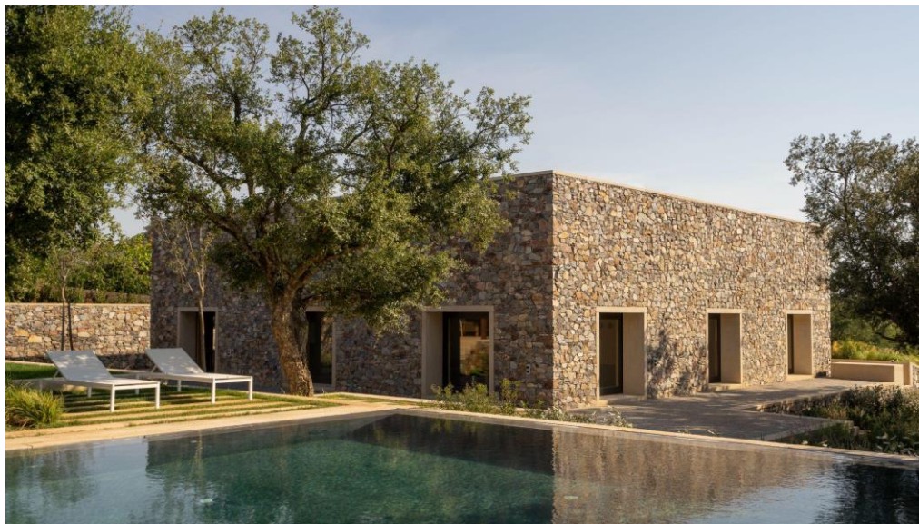
Casa de Piedra, Cáceres. Emilio Tuñón, 2019. Fotografía de Luis Asín