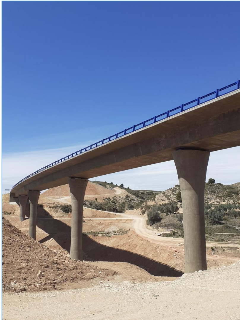
Viaducto sobre río Guadalopillo