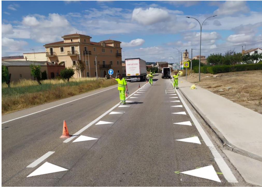
Señalización tipo diente de dragón prevista en el proyecto.