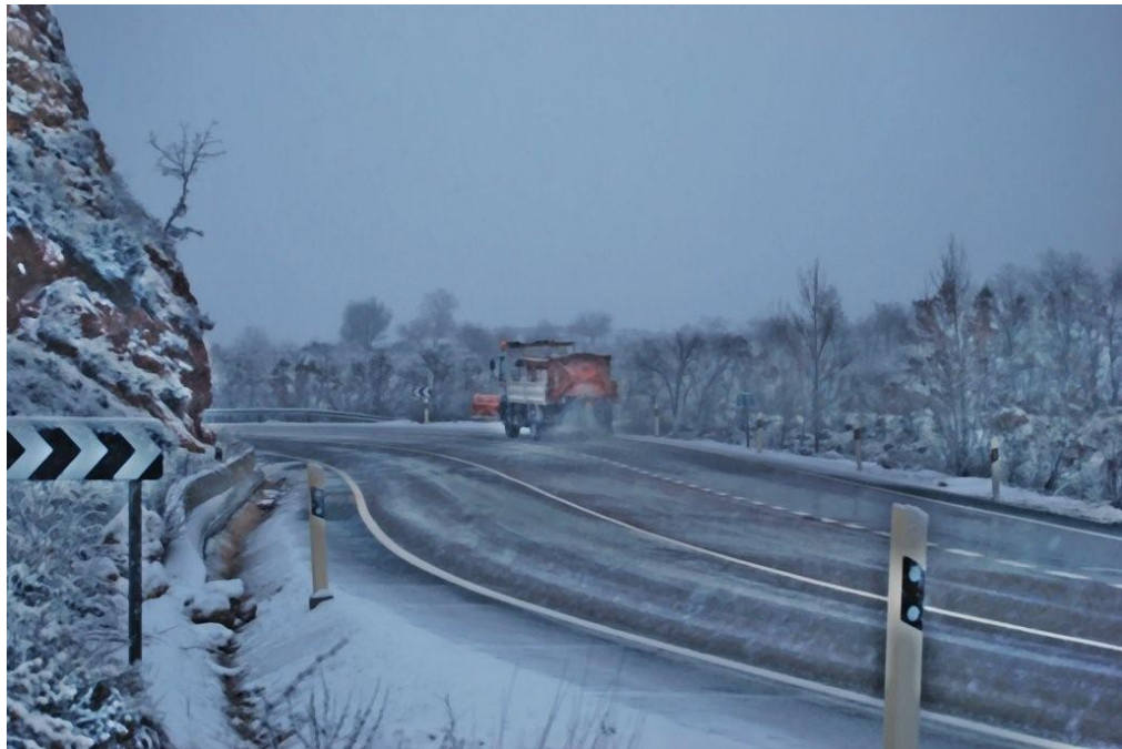
N-204 Pk 61 - Trabajos de vialidad invernal