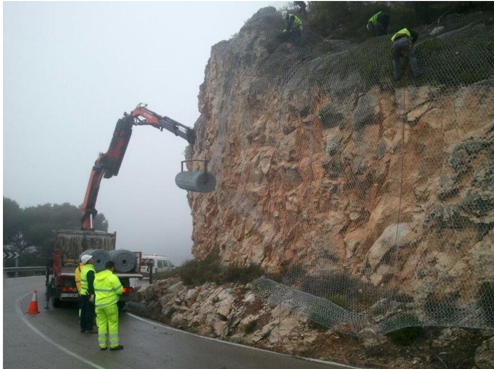
N-320 Pk 225 - Instalación de malla de protección en talud