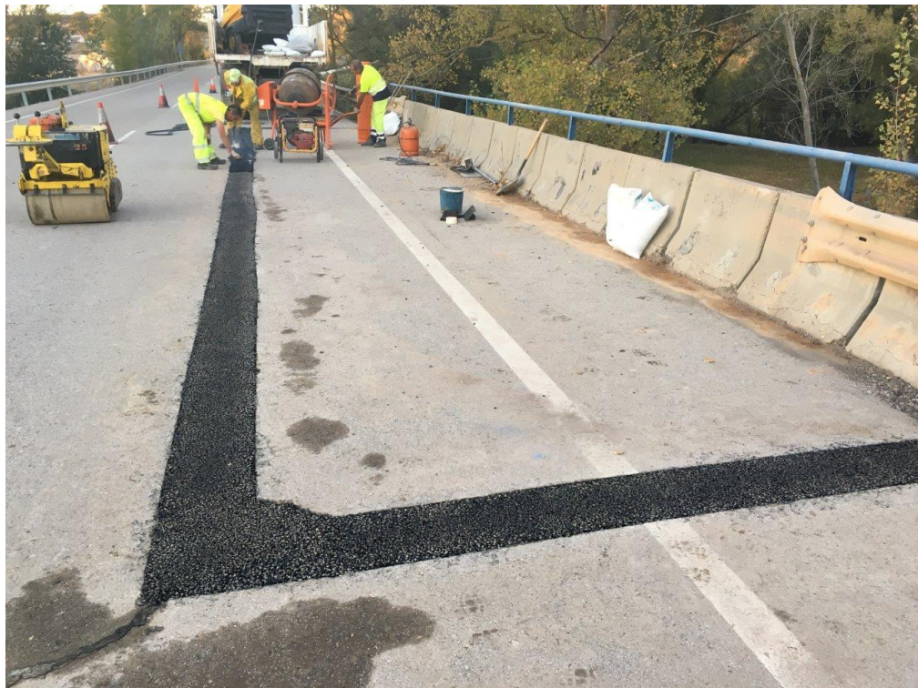
N-204 Pk 54 - Construcción de junta de dilatación