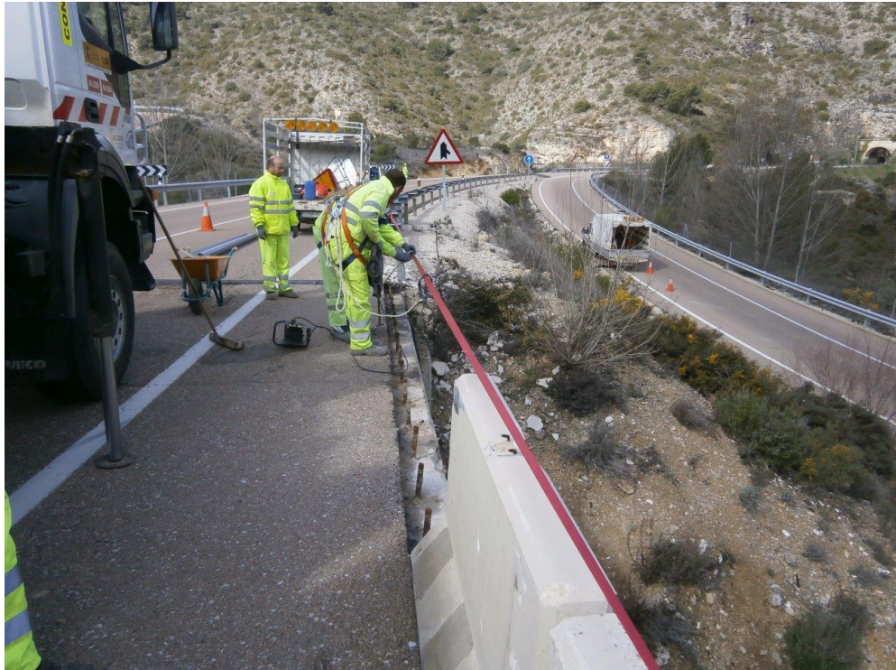
N-320 Pk 222,8 - Reparación de pretil