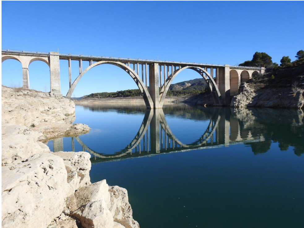
N-204 Pk 19 - Viaducto de Entrepeñas

Con este nuevo modelo se refuerza la orientación hacia los Objetivos de Desarrollo Sostenible (ODS) con los que está comprometido Mitma.