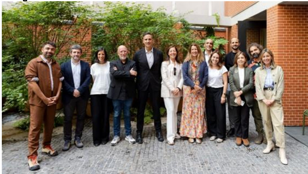
Jurado TAC! 2023 en las jornadas de deliberación el pasado 31 de mayo en la sede de la Fundación Arquia