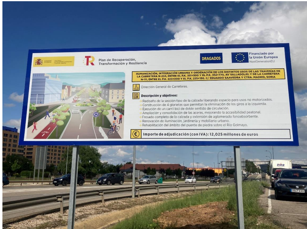
Cartel de obra instalado