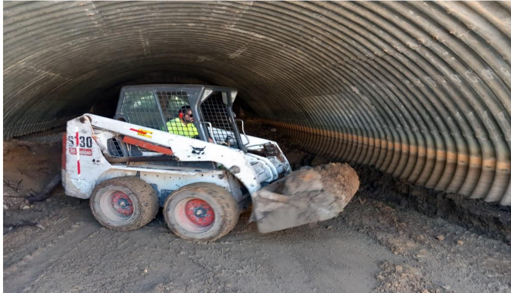
Limpieza de ODT en el P.K. 524 de la A-4