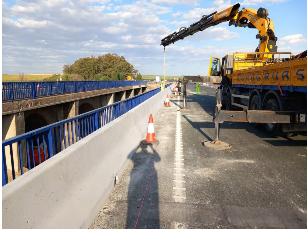
Colocación de barrera New Jersey en el p.k. 473 de la A-4