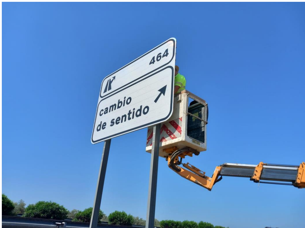
Colocación de cartel en el P.K. 464 de la A-4