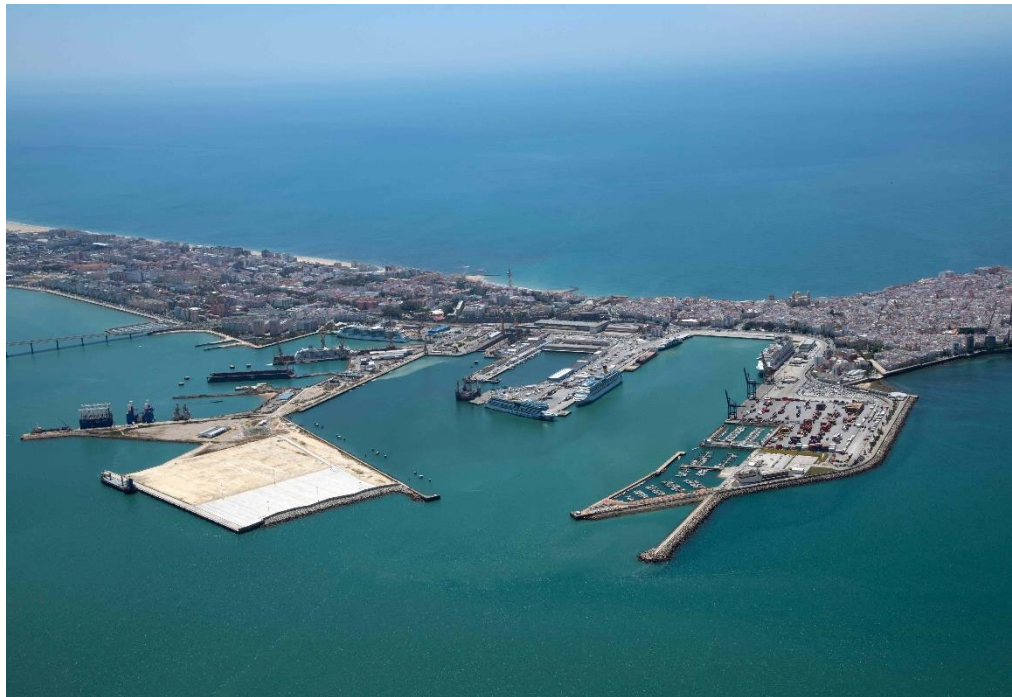
Puerto Bahía de Cádiz