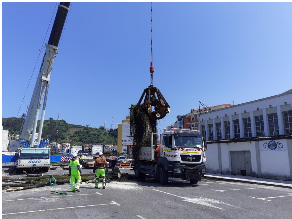
Otros trabajos de conservación y mantenimiento.