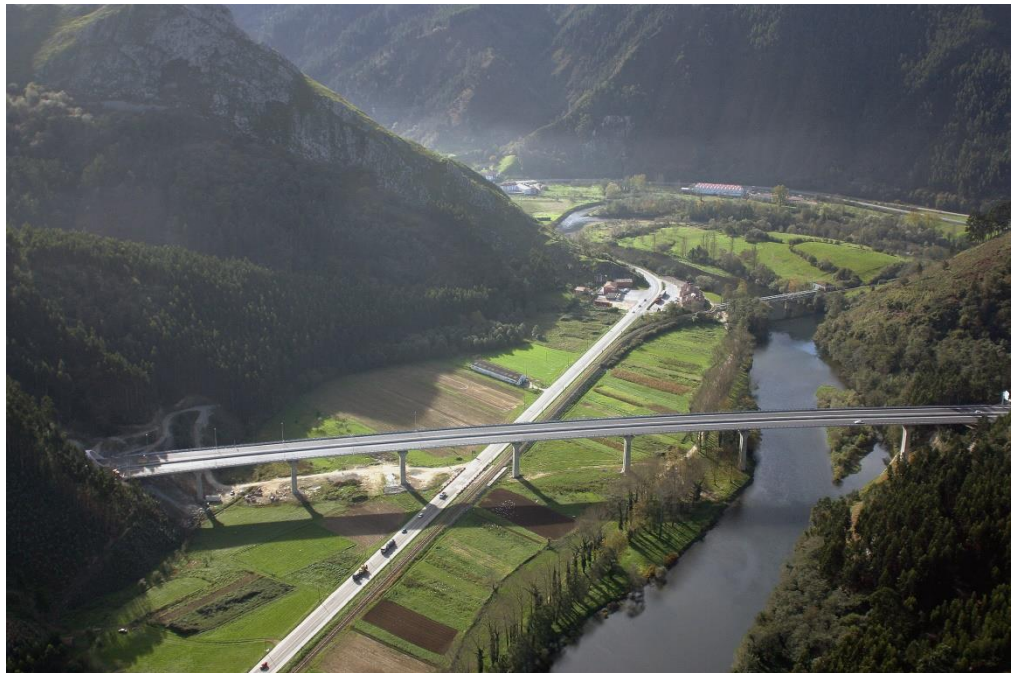
Viaducto del Sella en el km 320,250 de la autovía A-8 (542 metros de longitud).