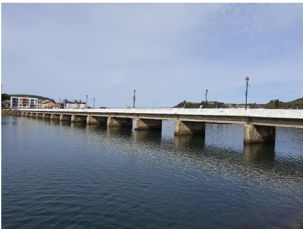
Puente sobre el río Sella en el km 3,000 de la N-632.