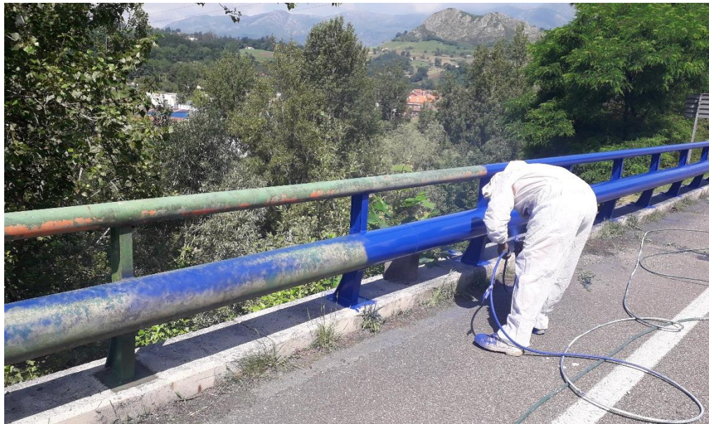
Trabajos de repintado de pretilos.