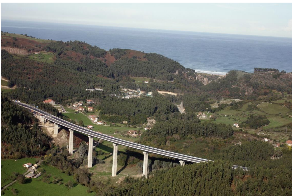
Viaducto del Acebo en el km 326,500 de la autovía A-8 (466 metros de longitud).