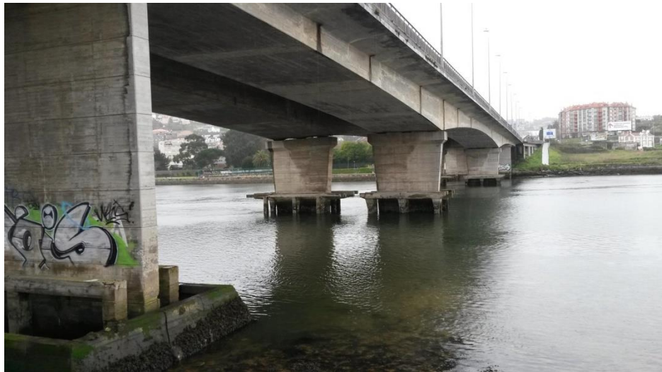
Imagen del puente actual