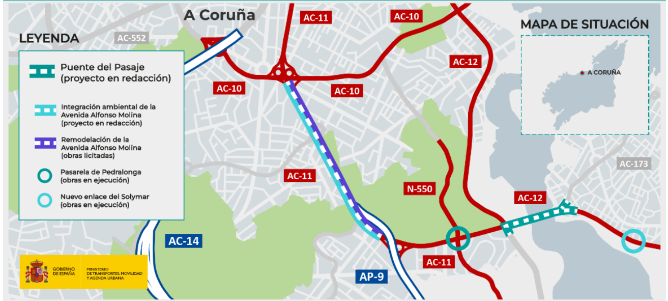
Ubicación del Puente del Pasaje y de las actuaciones próximas en el entorno