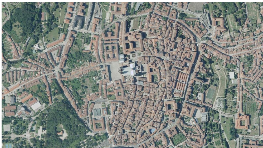
Santiago de Compostela, Galicia