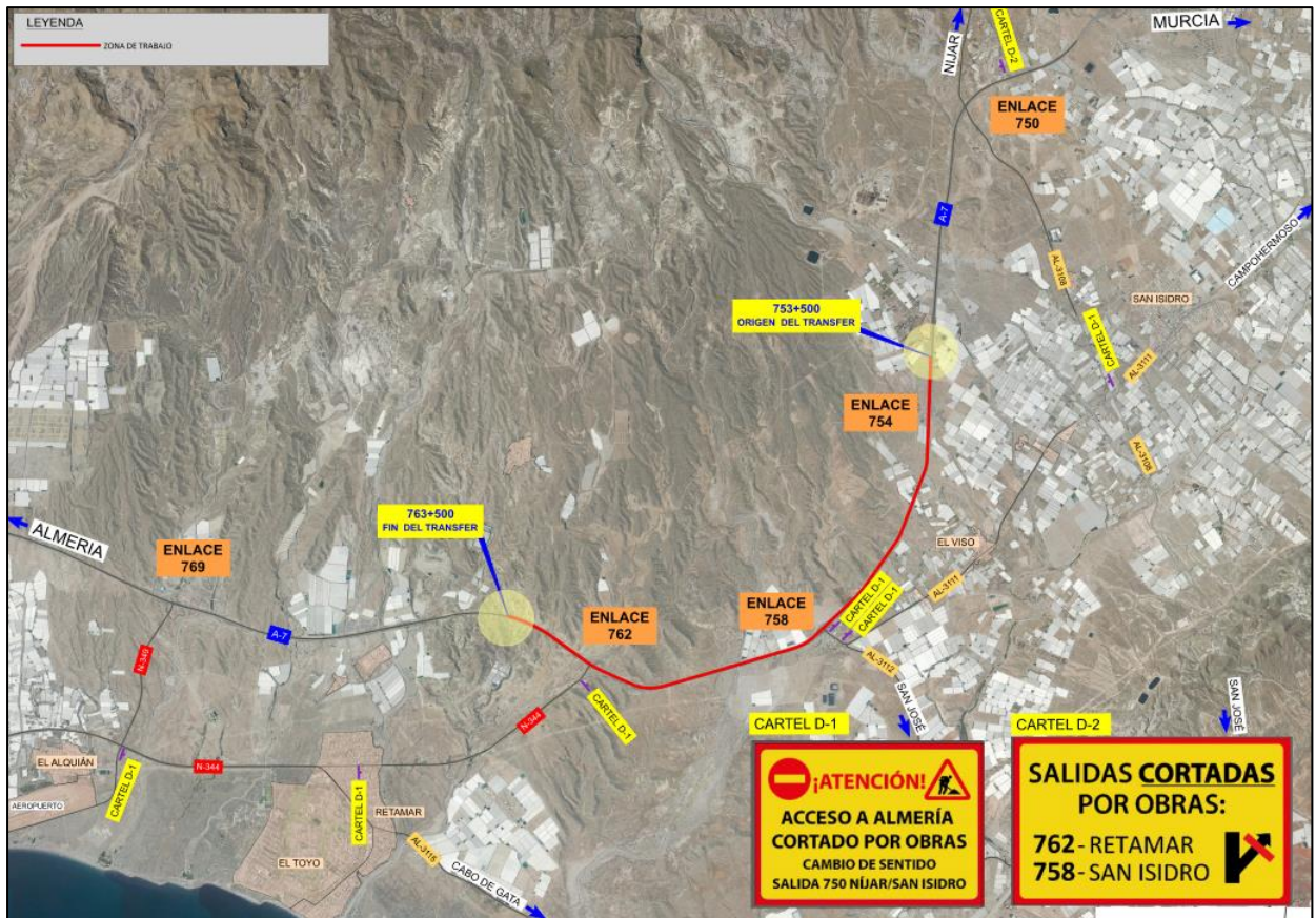
Ilustración 3.Fase 3