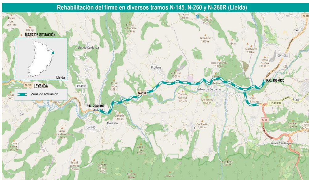
Croquis de ubicación actuaciones N-260 y N-260R