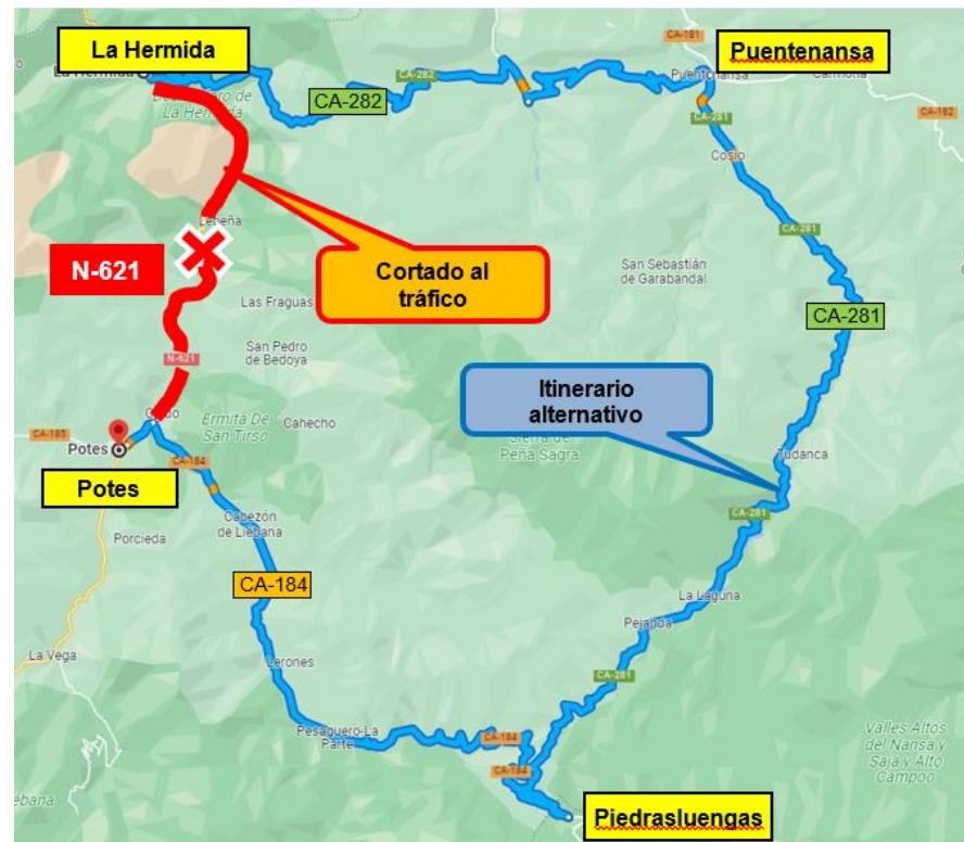
Itinerario alternativo para el corte de la noche del 15 al 16 de noviembre