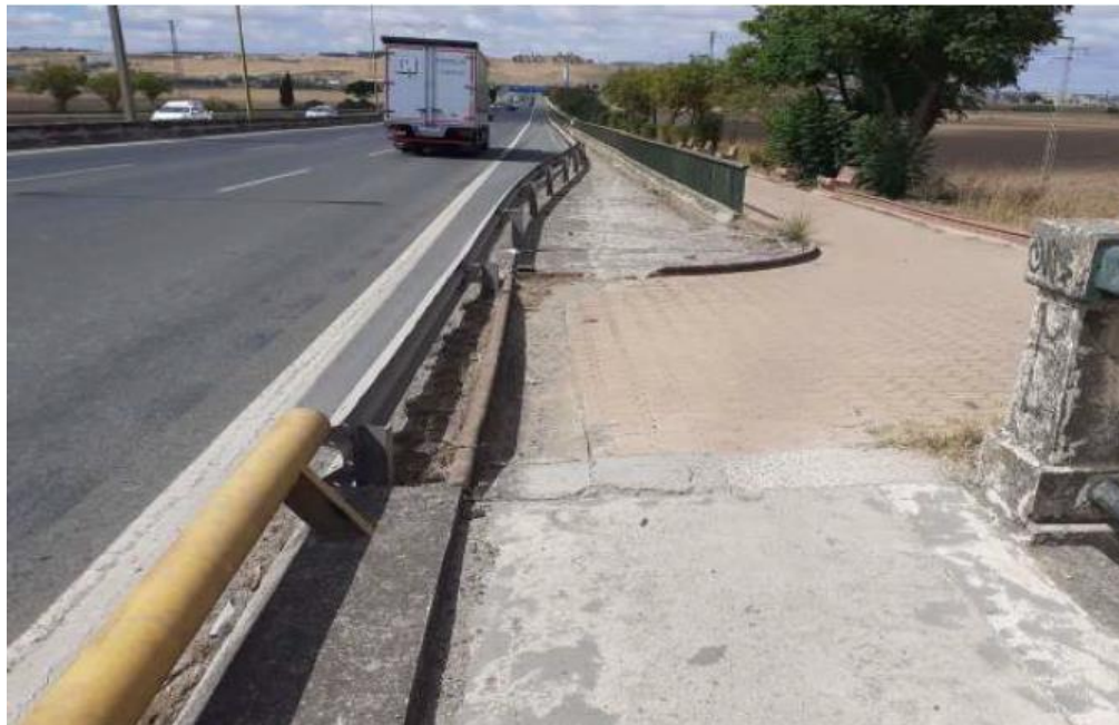
Aspecto actual de vial adoquinado de acceso al puente