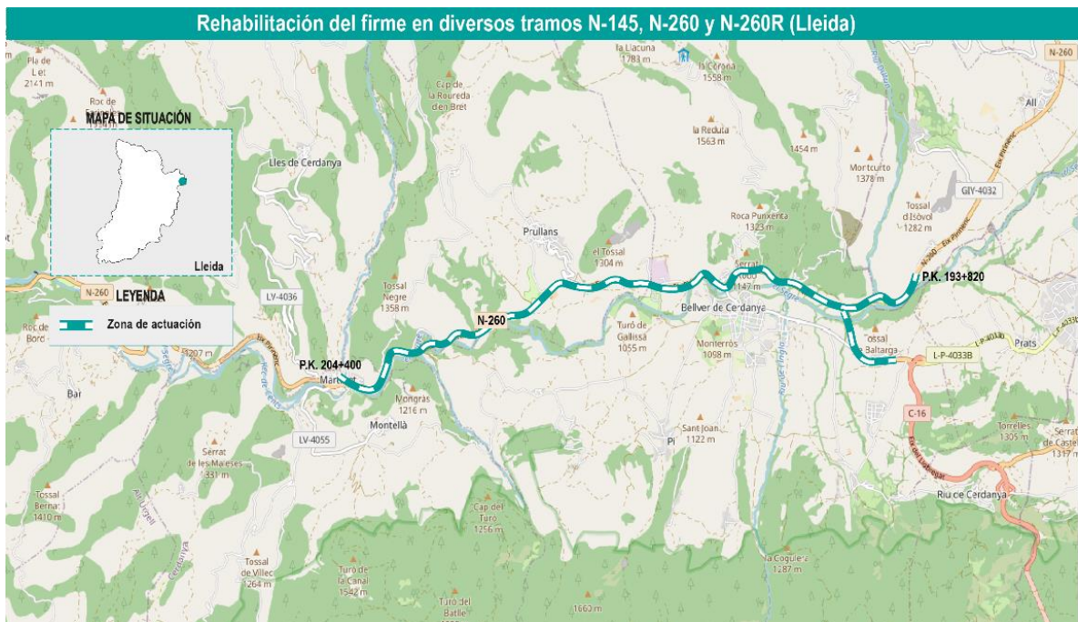
Croquis de ubicación actuaciones N-260 y N-260R