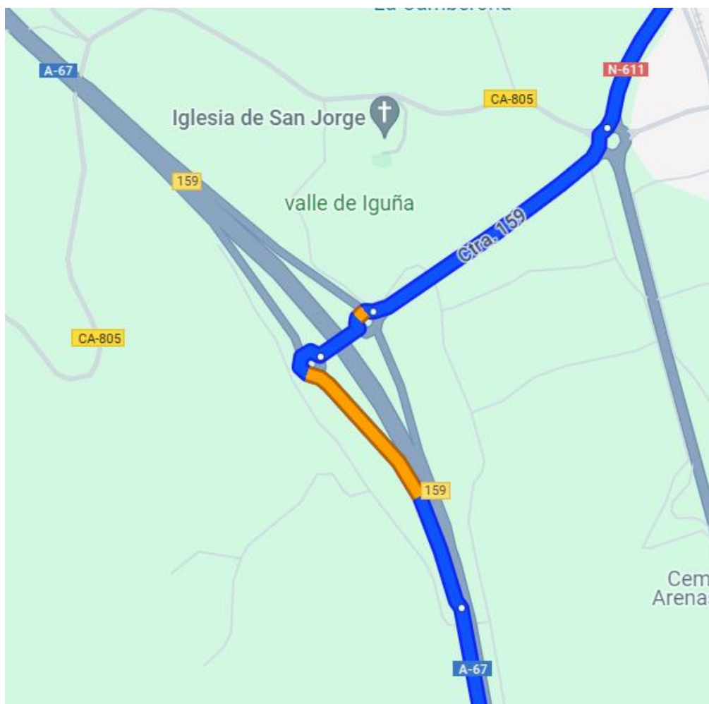
Incorporación en enlace 159 de la A-67