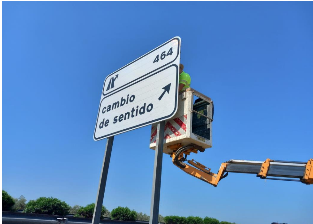
Colocación de cartel en el P.K. 464 de la A-4