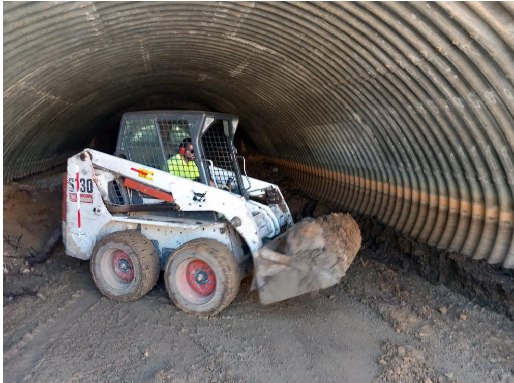
Limpieza de ODT en el P.K. 524 de la A-4