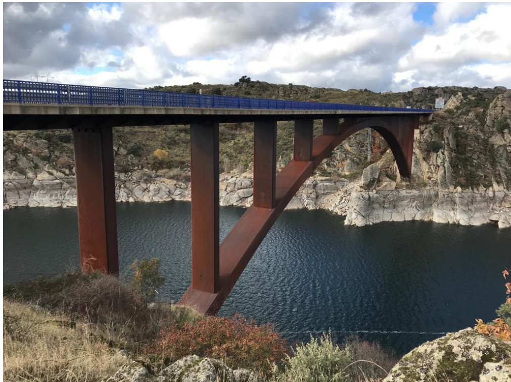
Viaducto sobre embalse de Ricobayo N-122 PK 480+150