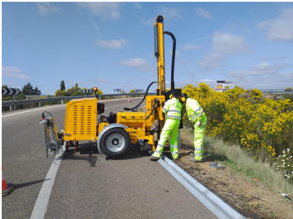
Colocación barrera seguridad ZA-13 PK 2+000