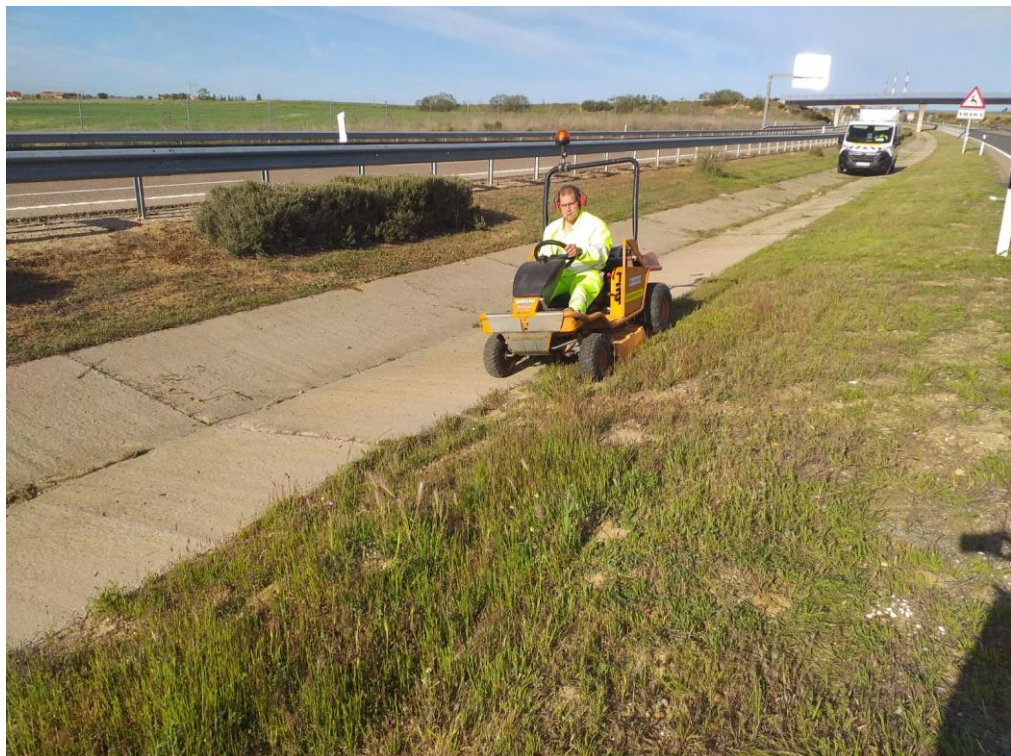
Segado de mediana A-11 PK 440+500