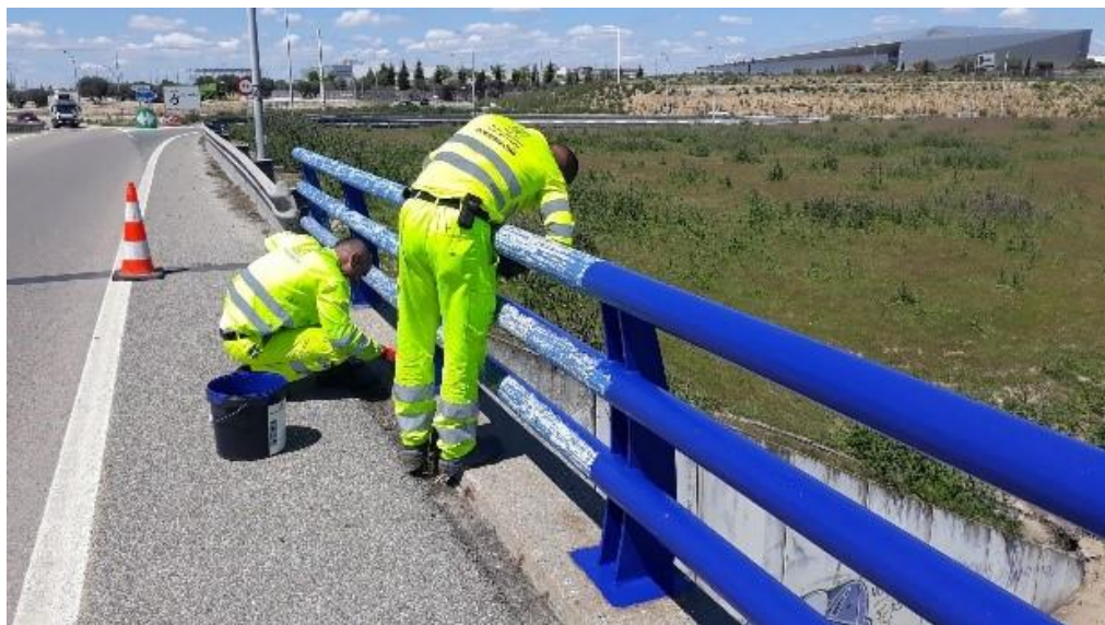
Repintado de barandillas en el km 21,300 de la A-42