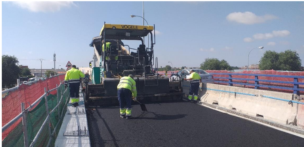
Asfaltado del tablero de km 19,600 de la A-42

A continuación, se muestran algunas imágenes del sector y de los trabajos que se realizan con este tipo de contratos: