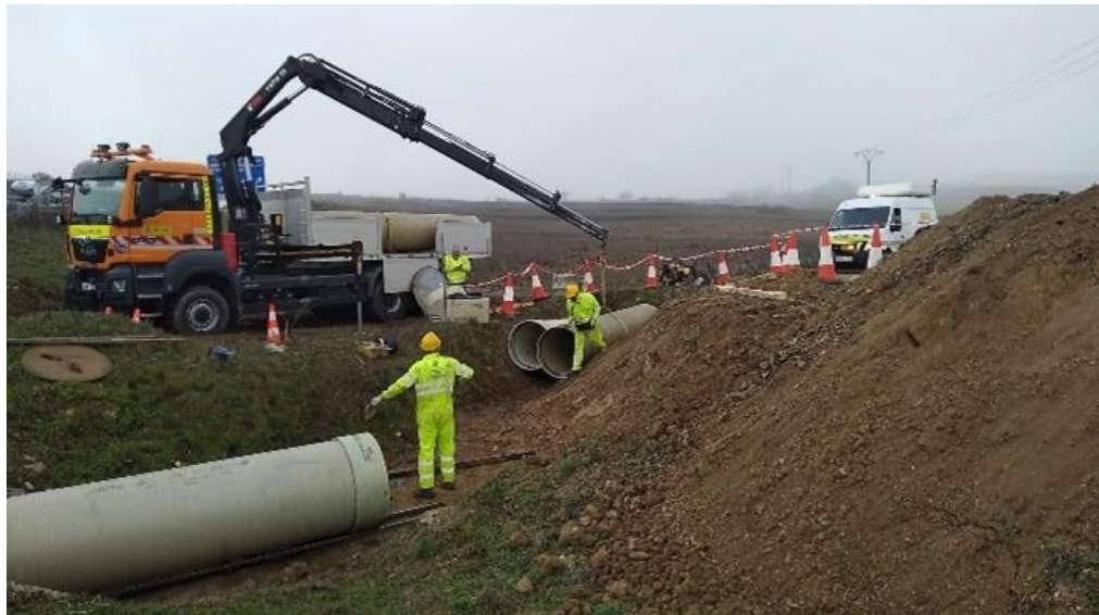
Reparación de ODT en el km 30,050 de la A-5