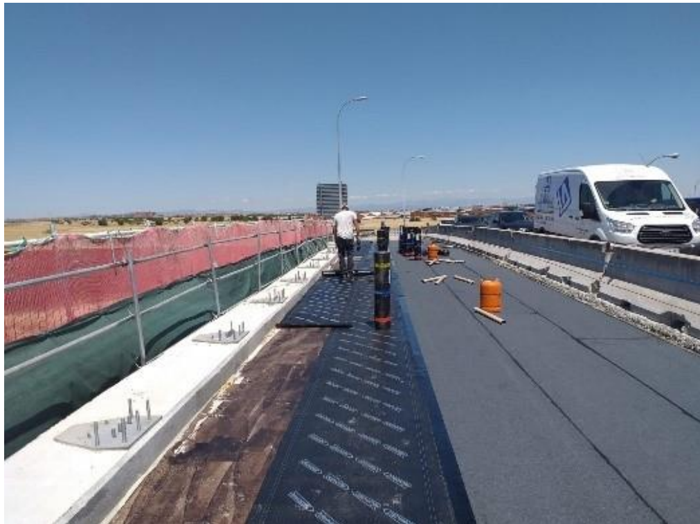
Impermeabilización de tablero km 19,600 de la A-42